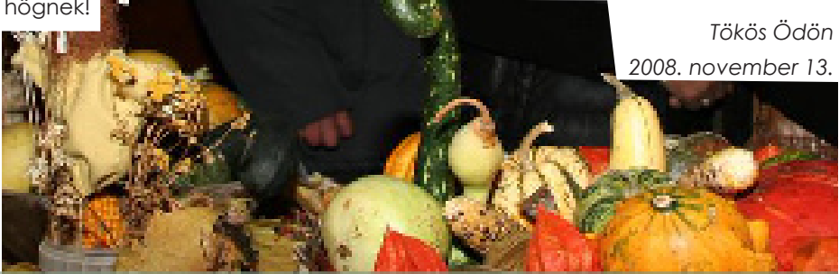
Tökös Ödön 2008. november 13.

Minden nap tisztelettel adóz a töködnek, mert amíg azt nézik, nem rajtad rhögnek!