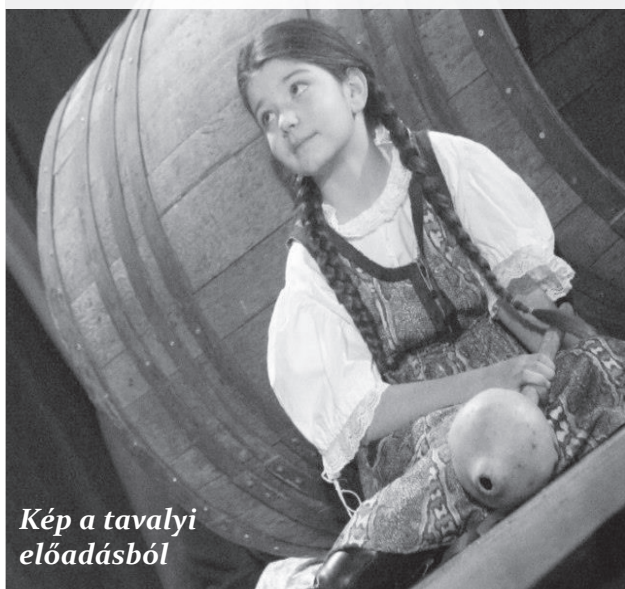
Kép a tavalyi előadásból