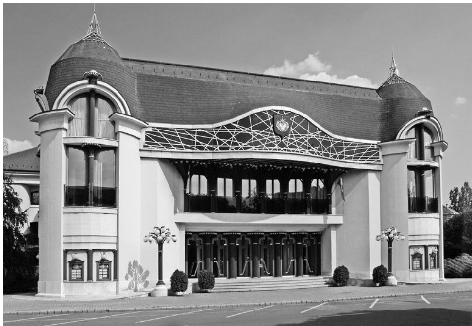
A szolnoki Szigligeti Ede Színház